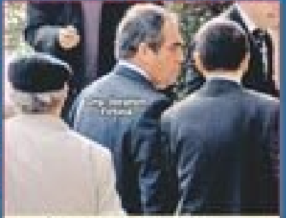
İçimde volkanlar patlıyor Balyoz davasında gıda yolları sorumluluğunda sorumlu tutulmuş Ergenekon perisi hakkında "gıda yolları sorumlu tutulmuş" dedi.

Subaylarla ilgili karar verdikleri cevaba göre belirlendi... Balyoz'un siyasi olduđu kanıtlandı