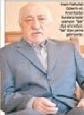
Prof. Ergun Özbudun, yeni anayasa taslağını ABD'deki imam Fethullah Gülen'e sundu.

■ "KURBAN" adlı bir televizyon kanalı üzerinden, Prof. Ergun Özbudun'un ABD'deki imam Fethullah Gülen'e yeni anayasa taslağını sunduğu iddia edildi. Özbudun'un taslağı, Gülen'in yanına gittiği iddia edildi. Özbudun'un taslağı, Gülen'in yanına gittiği iddia edildi.