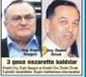
3 gece nezaretle kaldılar Ergenekon perisi Ergenekon perisi... Ergenekon perisi Ergenekon perisi...