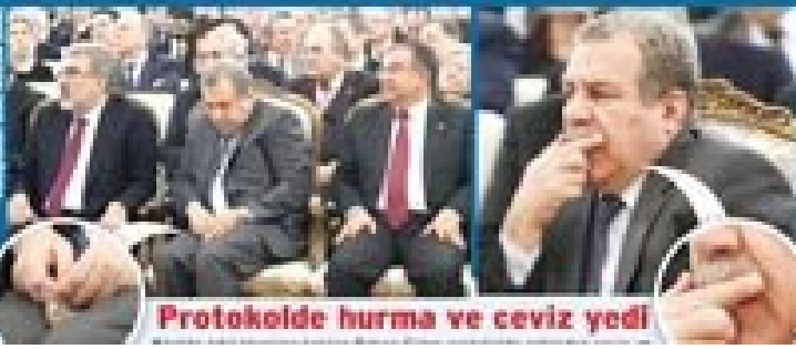
Protokole hurma ve ceviz yedi