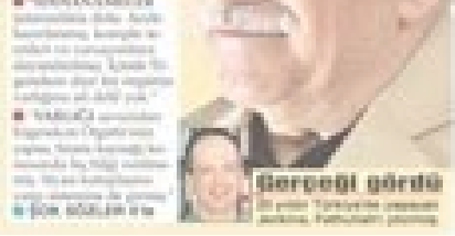
Gerçeği gördü Erdoğan, Ergenekon soruşturmasını yönetmedi, Fethullah Gülen hareketi...