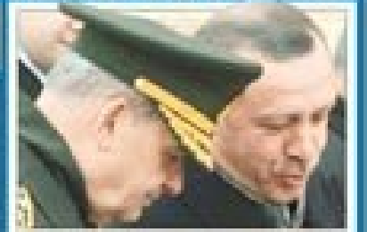
Recep Tayyip Erdoğan ve Abdullah Gül'ün görüşmesi. 1 saat 20 dakika sürdü.