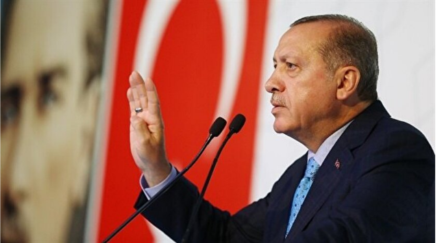
Recep Tayyip Erdoğan

Haber Merkezi · 07 Haziran 2017, 21:25 · Son Güncelleme: 07 Haziran 2017, 22:16 · AA