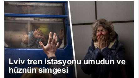
Lviv tren istasyonu umudun ve hüznün simgesi