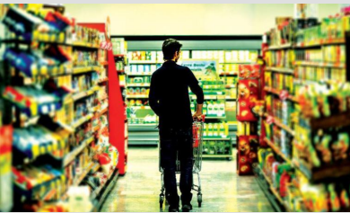
Uzmanı açıkladı: Gıdalardaki hileyi nasıl anlarız?