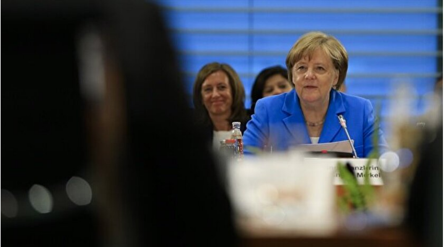
Almanya Başbakanı Angela Merkel

Haber Merkezi · 13 Haziran 2018, 17:32 · Son Güncelleme: 13 Haziran 2018, 17:36 · AA