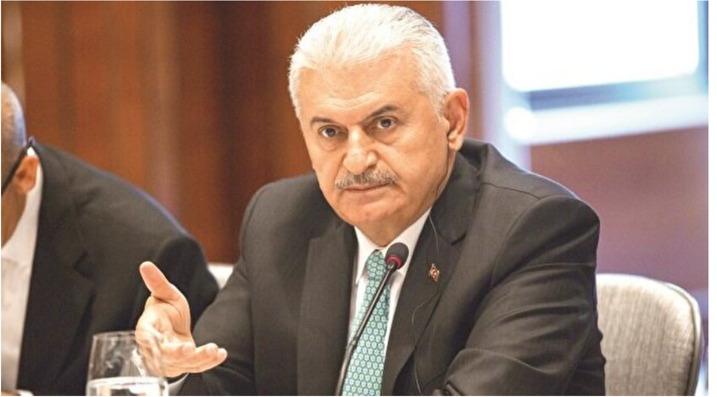
Başbakan Binali Yıldırım