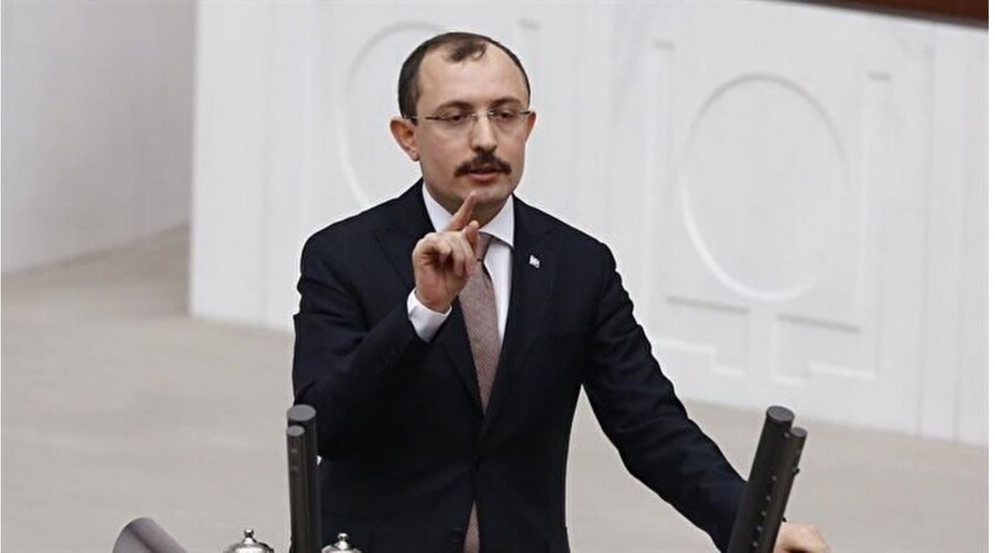
AK Parti Grup Başkanvekili Mehmet Muş