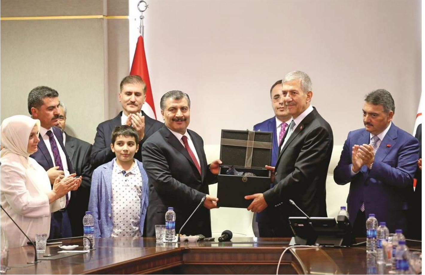
Fahrettin Koca - Ahmet Demircan

Bakanların yeminlerini tamamlamalarının ardından Geçici Başkan Durmuş Yılmaz oturumu, Meclis Başkanlığı seçiminin yapılacağı perşembe gününe kadar kapattı. AK Partililer ise yeni bakanları kutlamak için uzun kuyruk oluşturdu. Yeni bakanlar, oturdukları komisyon sıralarının önünde büyük kalabalık oluşturan AK Partililerin kutlamaları nedeniyle uzun süre salonda kaldı.