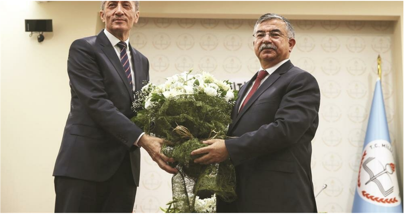
Ziya Selçuk - İsmet Yılmaz