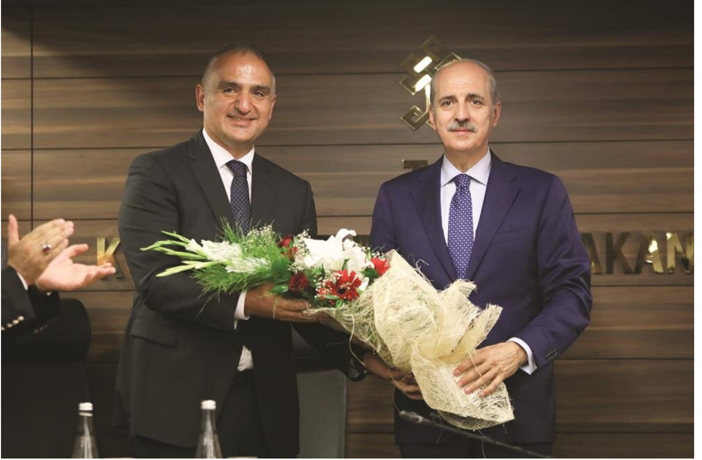
Mehmet Ersoy - Numan Kurtulmuş

Erdoğan, kabineyi oluştururken dikkat ettiği başlıklardan birisi terörle ile mücadele ve etkili savunma sanayi oldu. FETÖ ve PKK ile mücadele konusunda başarılı işler yürüten İçişleri Bakanı Süleyman Soylu ve Adalet Bakanı Abdülhamit Gül ile yola devam etme kararı aldı. Milli Savunma Bakanlığı görevine eski Genelkurmay Başkanı Hulusi Akar getirildi.