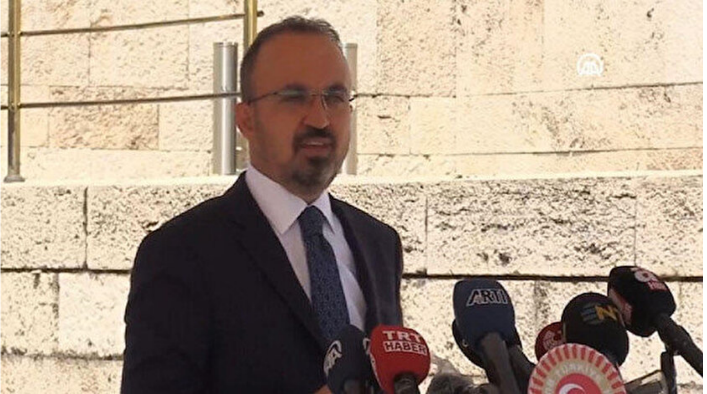
AK Parti Grup Başkanvekili Bülent Turan