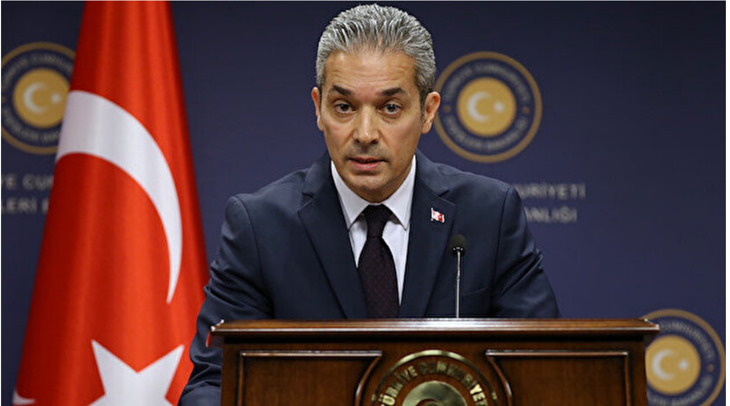
Dışişleri Bakanlığı Sözcüsü Hami Aksoy

Haber Merkezi · 13 Mayıs 2019, 18:29 · Son Güncelleme: 13 Mayıs 2019, 18:33 · IHA