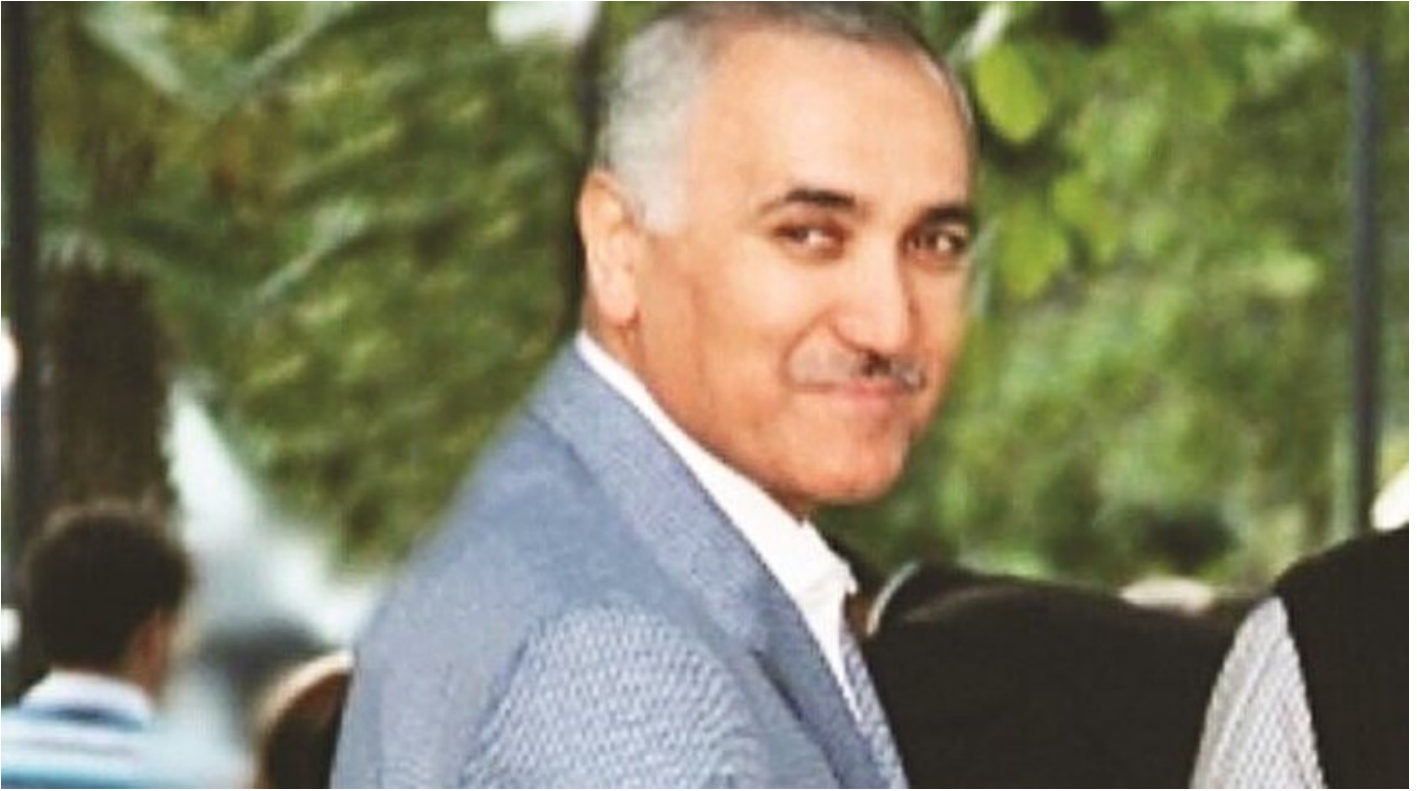
FETÖ'cü Adil Öksüz