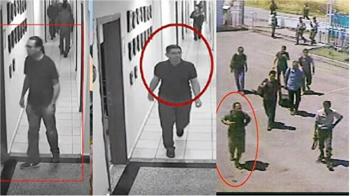
Akıncı'daki 10 sivil kayıp