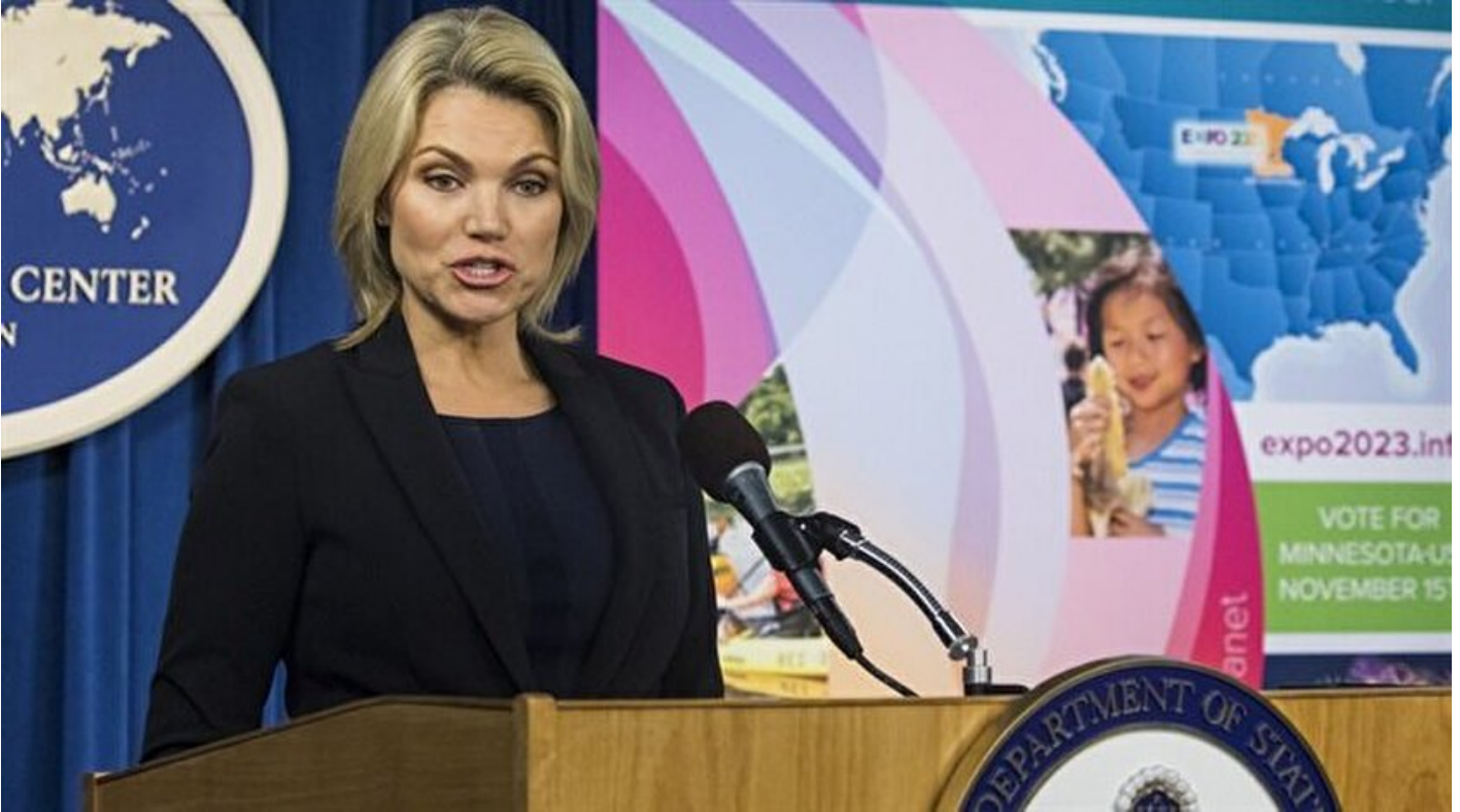
ABD Dışişleri Bakanlığı Sözcüsü Nauert

Haber Merkezi · 08 Mart 2018, 23:47 · Son Güncelleme: 09 Mart 2018, 08:17 · Yeni Şafak