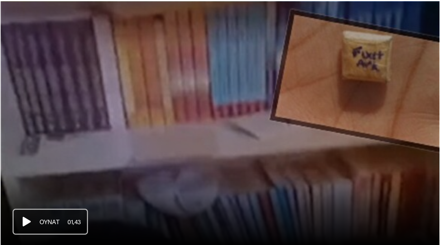
Canlı bomba notları vutmava çalıştı

“Bahoz” kod adını kullandığı belirtilen teröristin PKK/KCK terör örgütü adına faaliyet yürüttüğü, PKK/KCK terör örgütü içerisinde sorumlu düzeyde olduğu, PKK/KCK terör örgütünün sözde güvenlik tedbirleri prensiplerine bağlı kalarak cep telefonu kullanmadığı bunun yerine terör örgütü adına faaliyet yürüten kuryeler kullanarak terör örgütü yöneticileri irtibatlaştığı, PKK/KCK terör örgütü adına gerçekleştirilecek faaliyetlerini, eylem talimatlarını ve gerçekleşmiş faaliyet raporlarını kurye vasıtasıyla ilettiği, PKK/KCK terör örgütü adına eleman temin ederek terör örgütünün kırsal alanına gönderdiği, PKK/KCK terör örgütü adına canlı bomba eylemi yapabilecek örgütsel kapasitede olduğu belirlendi.