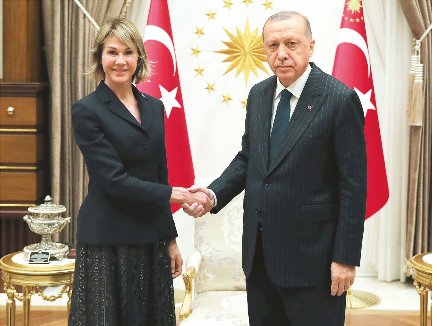
Kelly Craft ve Cumhurbaşkanı Erdoğan

Cumhurbaşkanı Erdoğan, AB Konseyi Başkanı Charles Michel'i, kabul etti. Yaklaşık 2 saat süren görüşmede mülteci krizi ele alındı. Erdoğan, ABD'nin BM Daimi Temsilcisi Kelly Craft'ı da kabul ederek basına kapalı olarak görüştü. Cumhurbaşkanı Erdoğan, daha sonra Fransa Cumhurbaşkanı Emmanuel Macron ile bir telefon görüşmesi gerçekleştirdi. Görüşmede, İdlib ve mülteciler meselesi ele alındı.