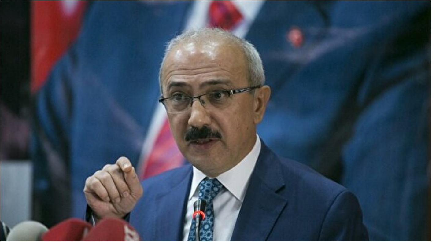
Kalkınma Bakanı Lütfi Elvan

Haber Merkezi · 20 Kasım 2016, 17:16 · Son Güncelleme: 20 Kasım 2016, 17:28 · AA