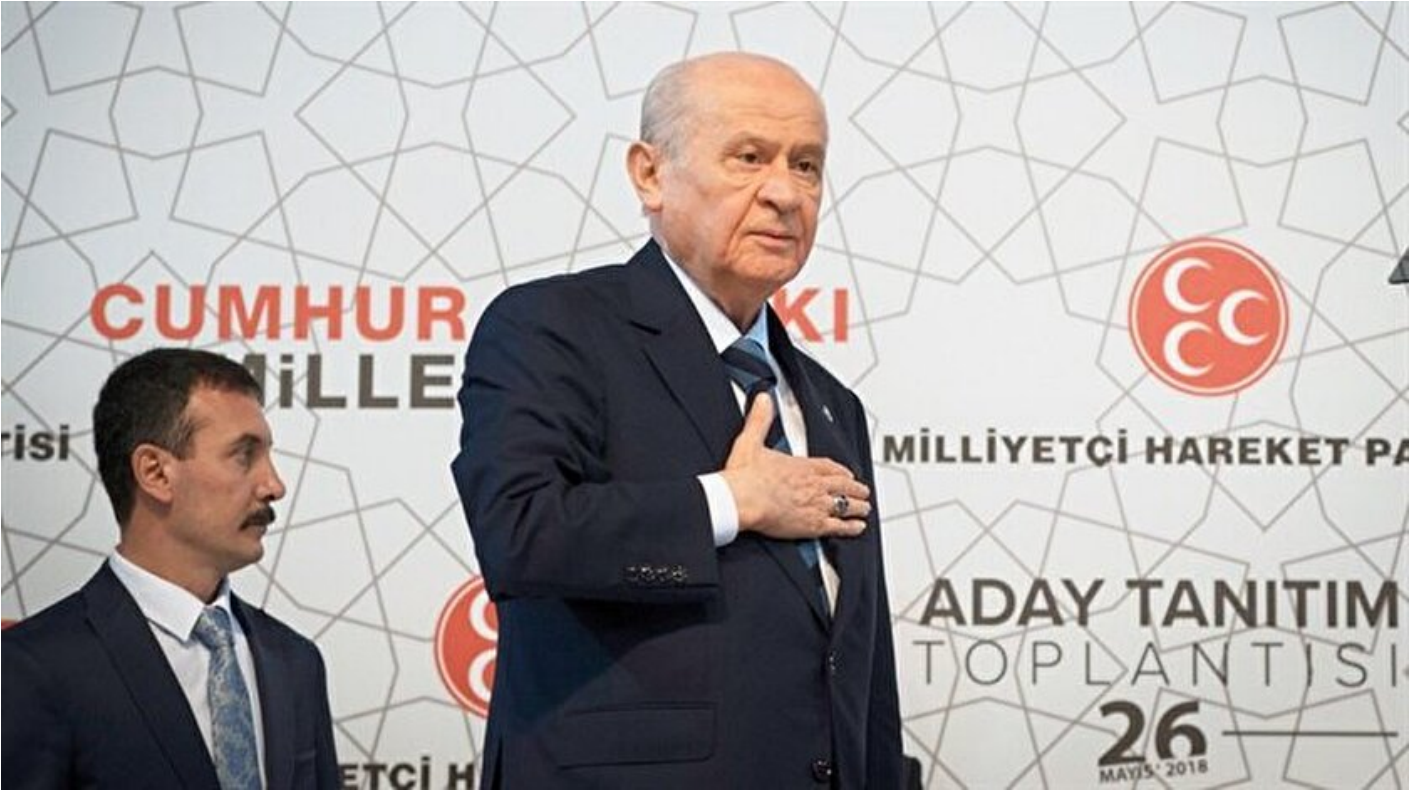
MHP lideri Devlet Bahçeli