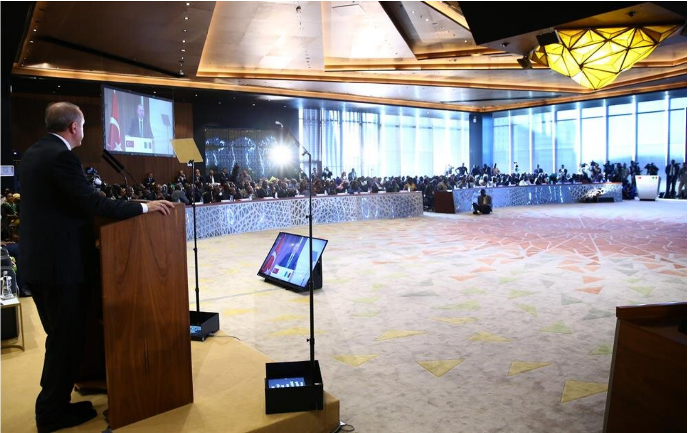
Cumhurbaşkanı Erdoğan, Türkiye-Senegal İş Forumu'nda konuşuyor.

Bu rakamın ülkeler arasındaki gerçek potansiyeli yansıtmaktan uzak olduğunu belirten Erdoğan, "Yeni belirlediğimiz hedefler ışığında ve ortak gayretle bu rakamın çok daha ötesine geçebiliriz. Bugünkü görüşmelerimizde de 400 milyon dolar hedefini ortaya koyduk. Ticaretimizin büyümesi kadar dengeli gelişmesi de önemlidir." diye konuştu.