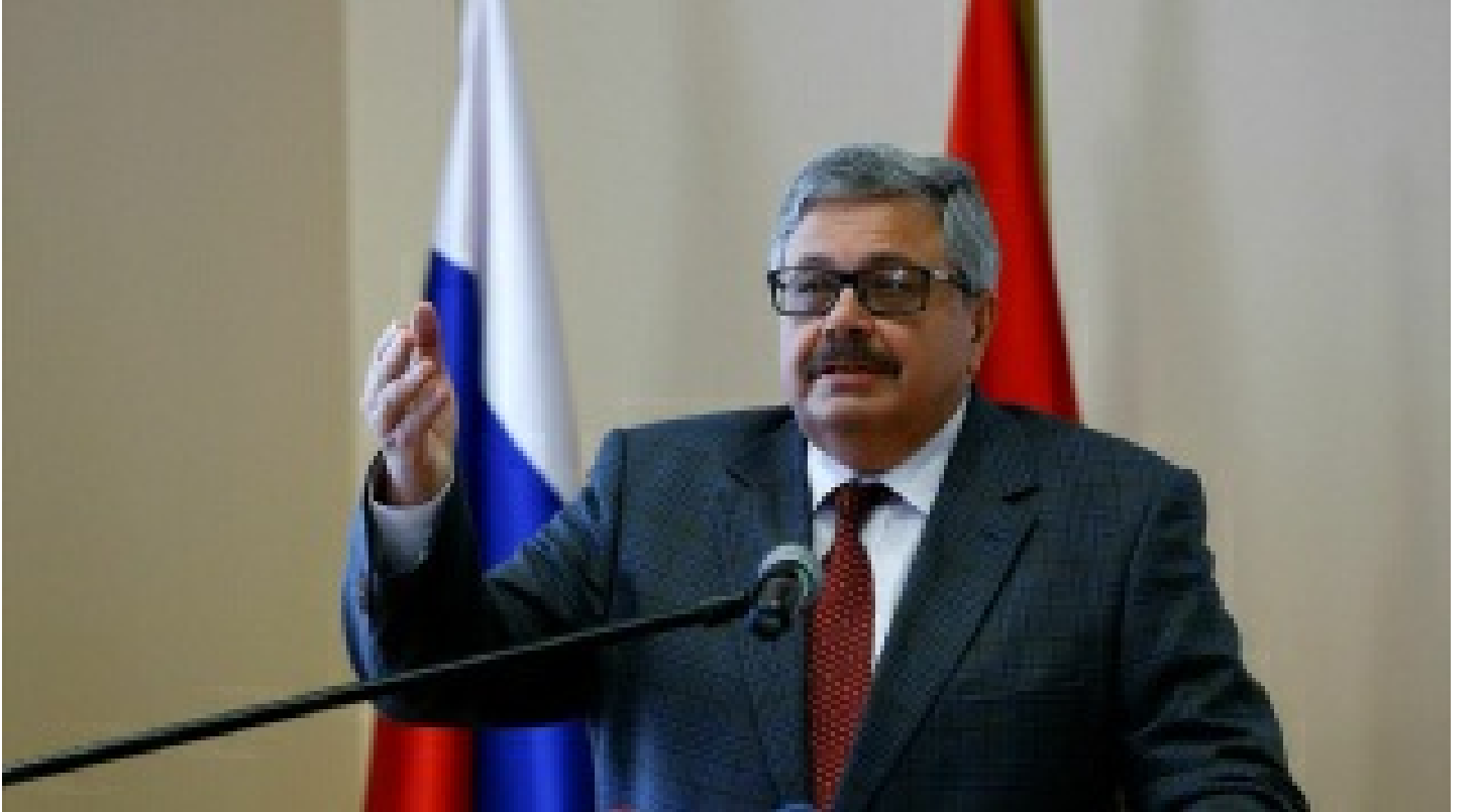
Rus Büyükelçi Yerkov: Türk-Rus ilişkilerini yıkmak için gösterilen çabaları biliyorum