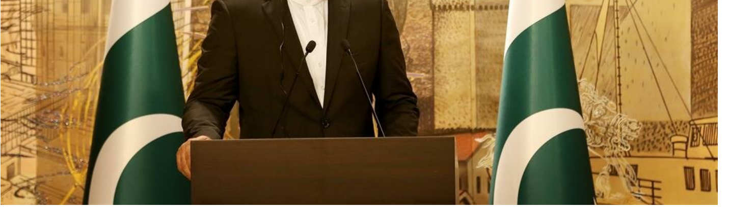
Pakistan Başbakanı Şahid Hakan Abbasi

"Bizim kanımızda Türkiye'ye bir sevgi var"