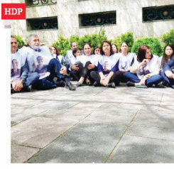
HDP'lilerden Leyla Güven için Meclis'te oturma eylemi