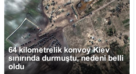
64 kilometrelik konvoy Kiev sınırında durmuştu, nedeni belli oldu