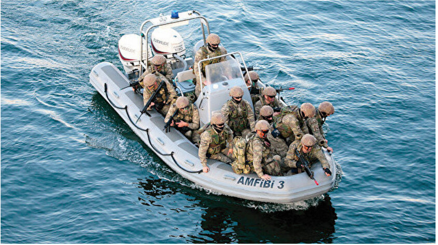
Mavi Vatan 2019 Tatbikatı