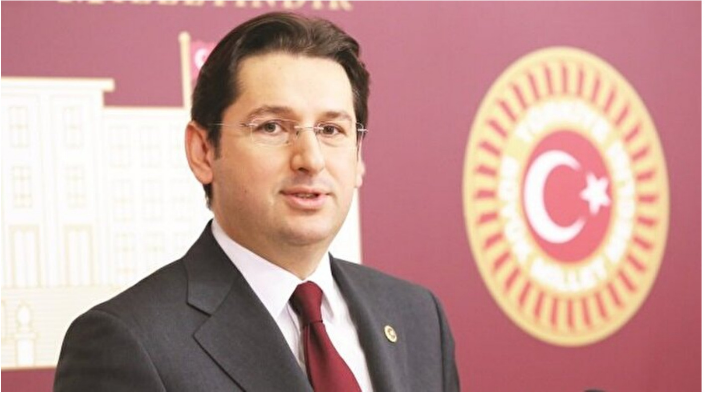
CHP Bursa Milletvekili Aykan Erdemir

Mustafa Sait Özkan · 07 Aralık 2017, 04:00 · Yeni Şafak