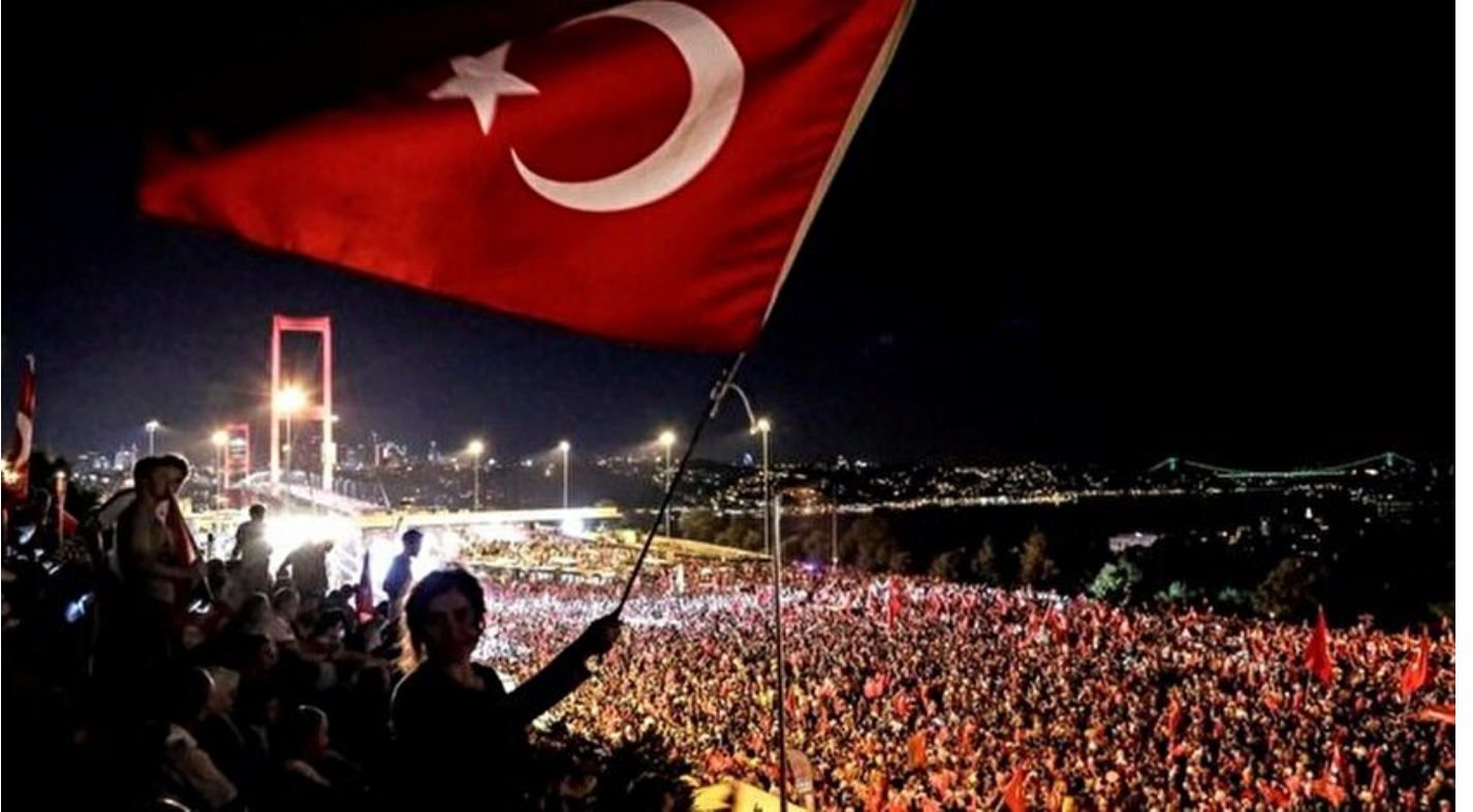
15 Temmuz şehitleri- 15 Temmuz Darbe girişimi şehitleri

Haber Merkezi · 10 Temmuz 2017, 21:24 · Son Güncelleme: 10 Temmuz 2017, 21:56 · Diğer