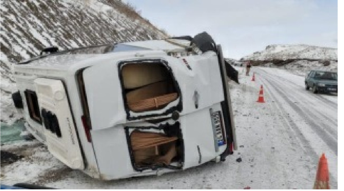
Erzincan'da devrilen minibüsteki 8 kişi yaralandı