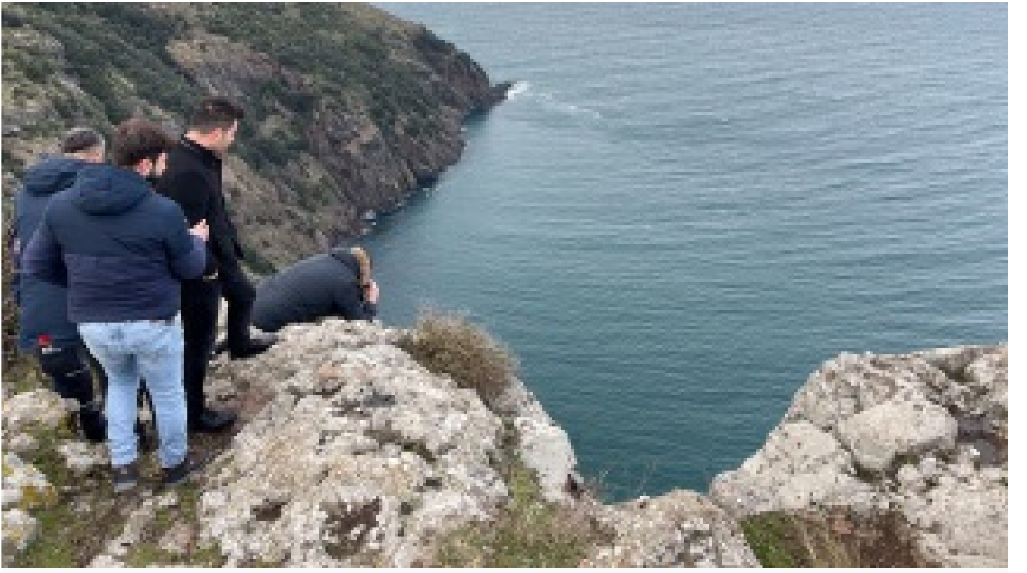
Sinop'ta uçurumda kadın cesedi bulundu