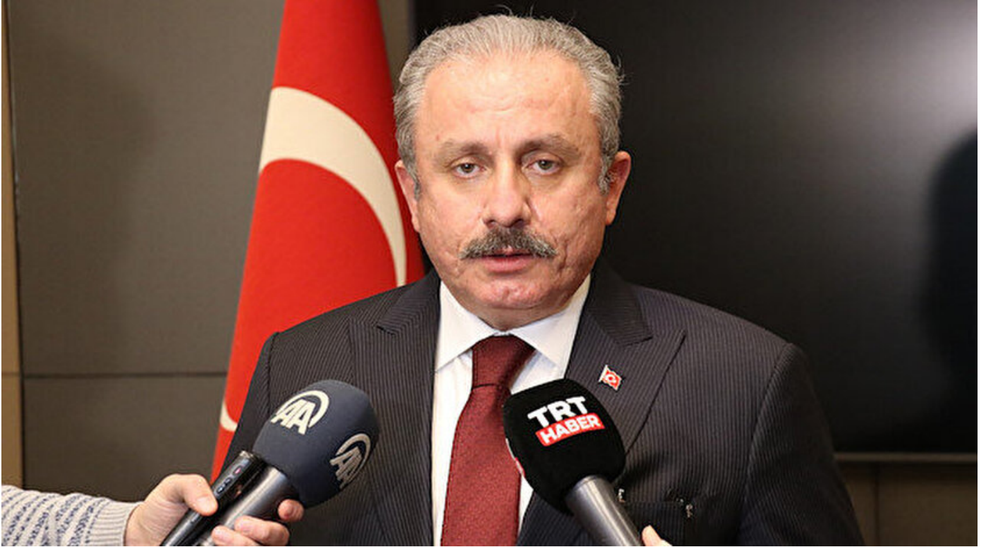
TBMM Başkanı Mustafa Şentop.

Haber Merkezi · 22 Aralık 2020, 14:57 · Son Güncelleme: 22 Aralık 2020, 15:08 · AA