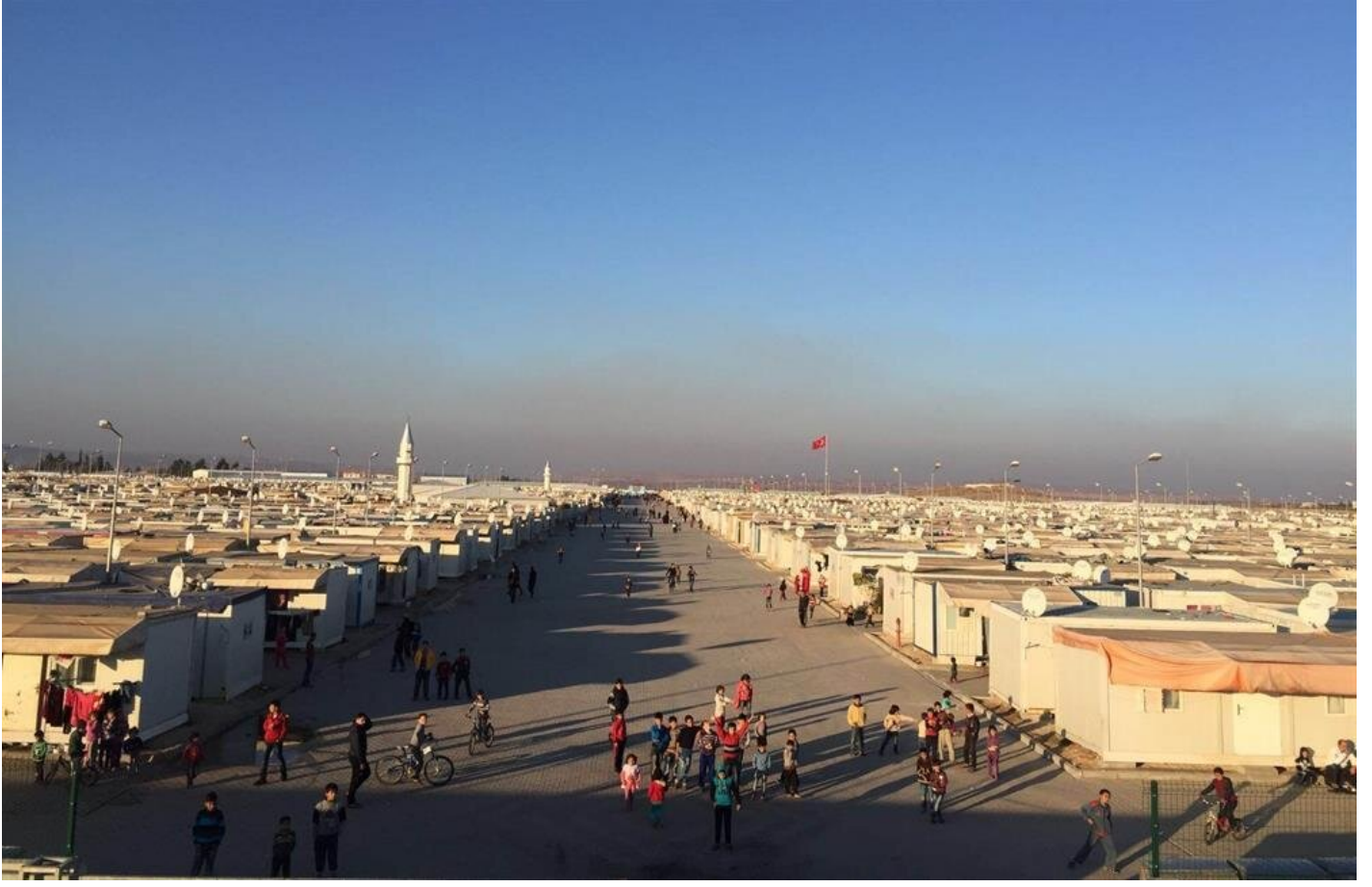
Suriyeli mülteci kampı

sayıları 3 milyonun üzerinde olan Suriyeli mülteciler için yapılan harcamanın 30 milyar doların üzerinde olduğu kaydedildi.