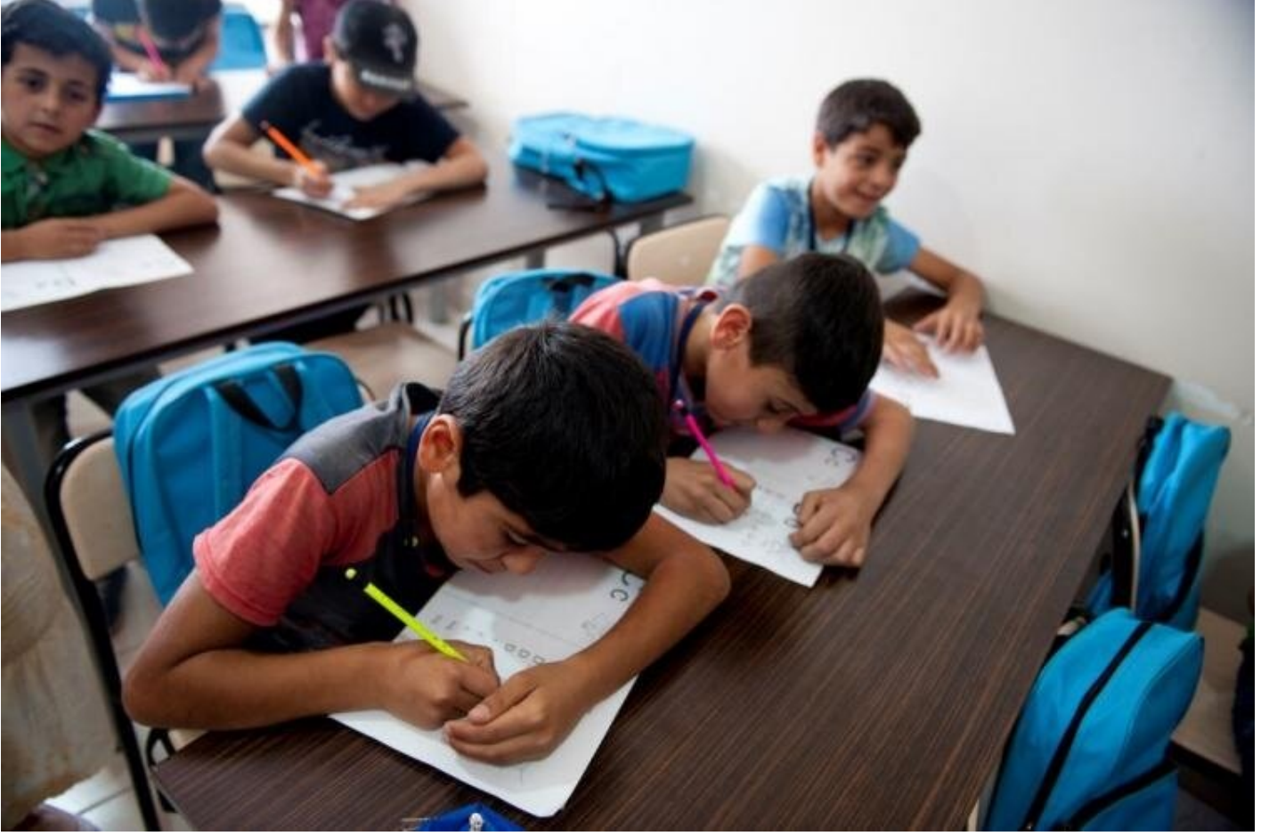
Suriyeli mülteci kampı