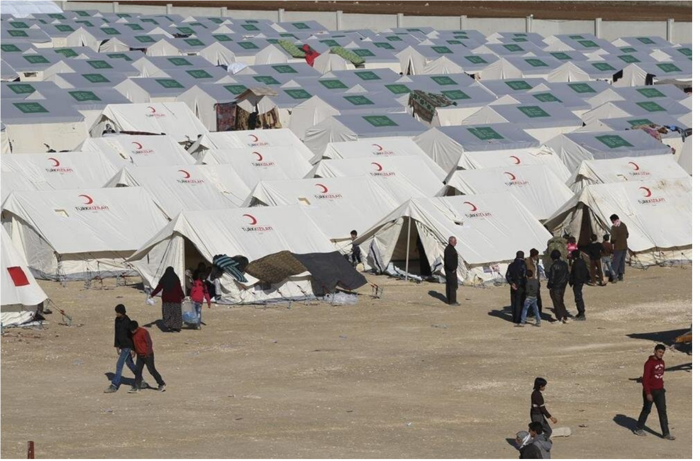
Suriyeli mülteci kampı