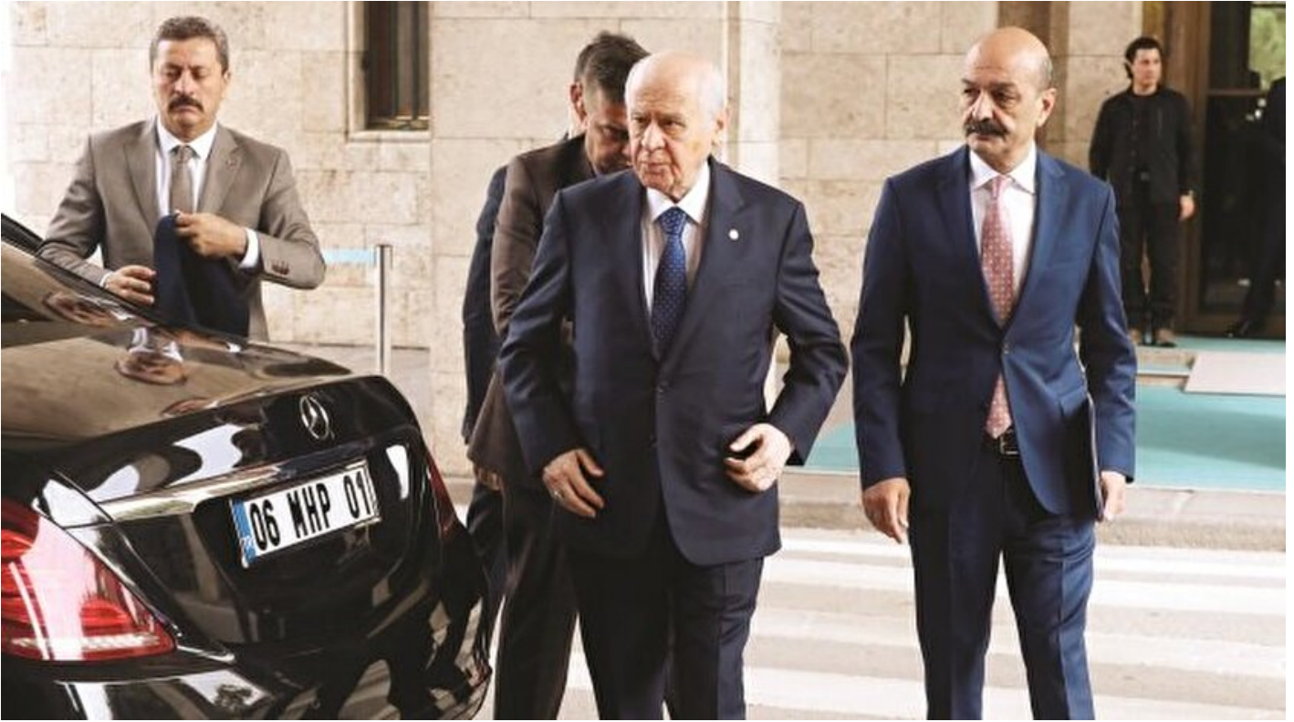
MHP Genel Başkanı Devlet Bahçeli,

Nur Banu Aras · 03 Ekim 2018, 04:00 · Son Güncelleme: 03 Ekim 2018, 08:34 · Yeni Şafak