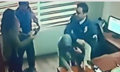
Yardım istedi, darbedilerek dışarıya atıldı