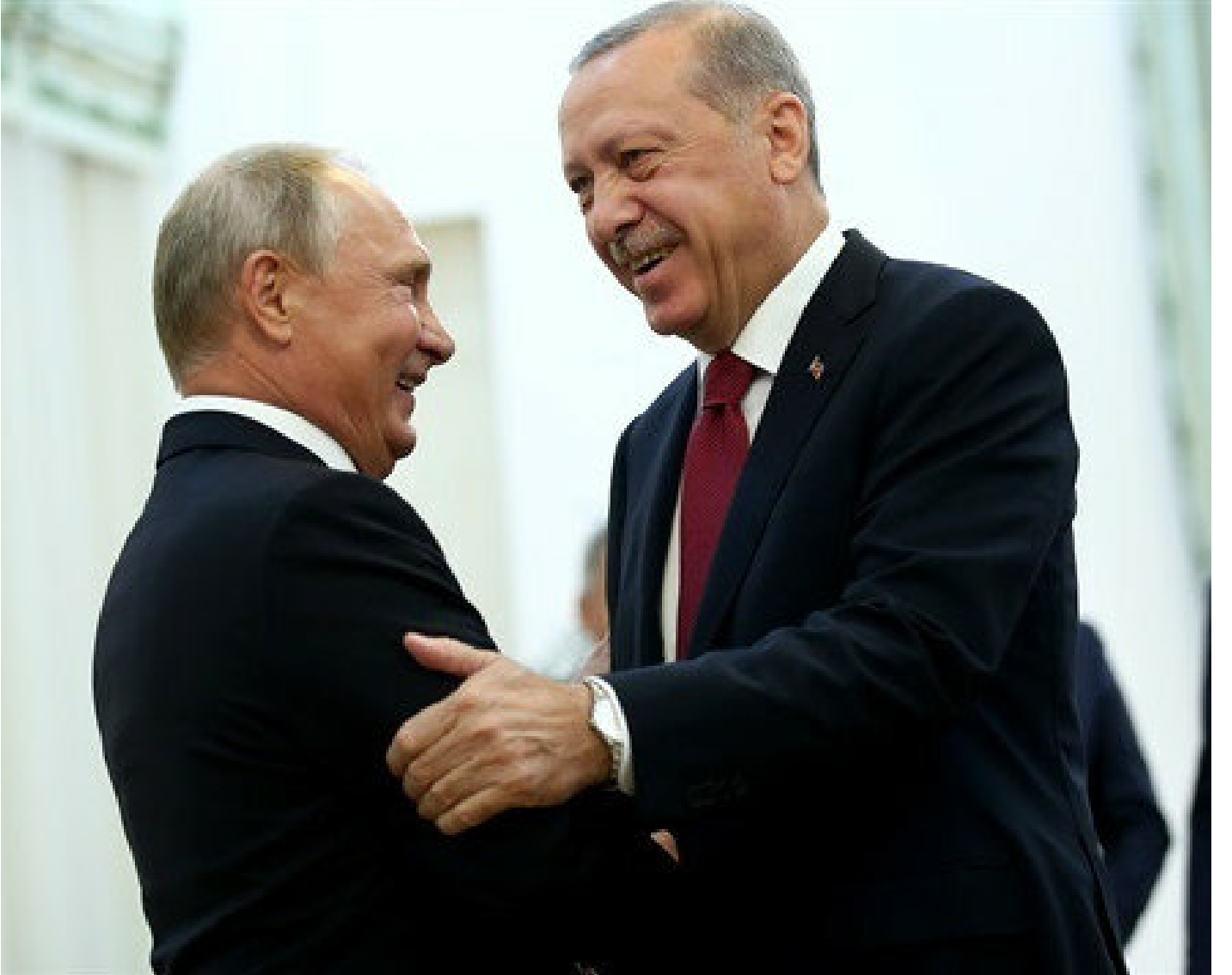
Vladimir Putin ve Recep Tayyip Erdoğan

Cumhurbaşkanı Tayyip Erdoğan, telefonla görüştüğü Rusya Devlet Başkanı Vladimir Putin ile başta İdlib olmak üzere Suriye ve Libya'daki gelişmeler ile ikili ilişkileri ele aldı. Görüşmede Putin, Erdoğan'ı Rusya'ya davet etti. Erdoğan, dün Putin ile telefon görüşmesi gerçekleştirdi. İletişim Başkanlığından yapılan açıklamaya göre görüşmede, Suriye ve Libya'daki gelişmeler ile ikili ilişkiler ele alındı. Görüşmede, Cumhurbaşkanı Erdoğan'ın, rejimin İdlib'deki ateşkes ihlalleri ve saldırılarının büyük bir insani krize yol açtığını, Suriye'deki çözüm çabalarına zarar verdiğini ve Türkiye'nin milli güvenliği bakımından da çok ciddi bir tehdide dönüştüğünü