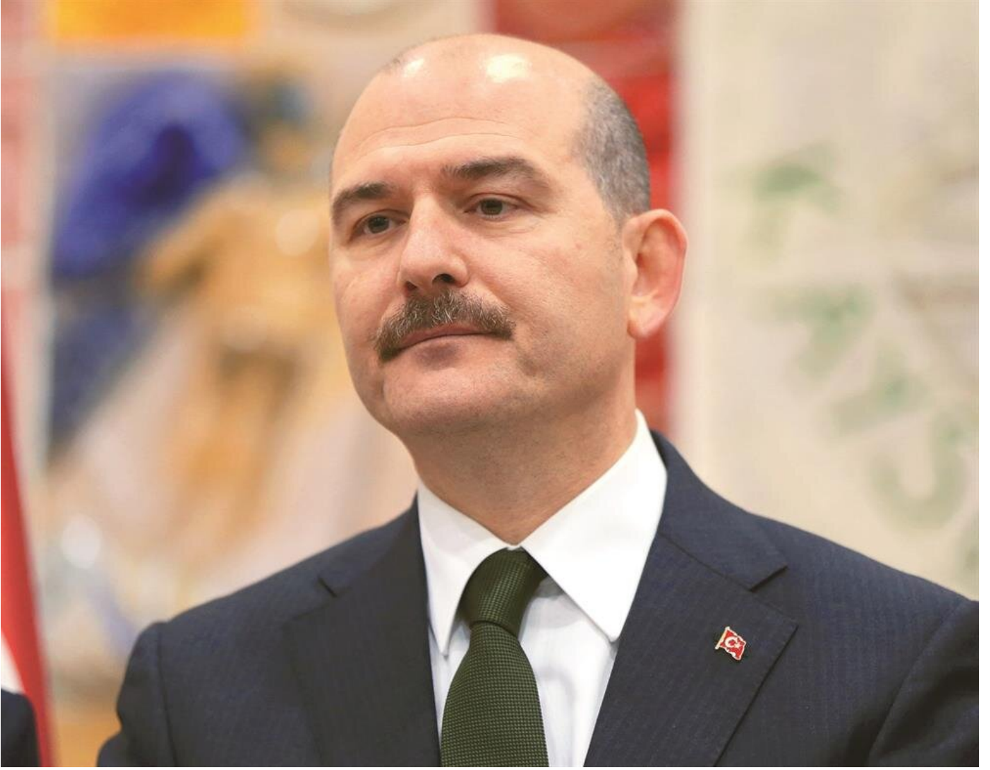
İçişleri Bakanı Süleyman Soylu