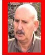
OK SABRİ ADİYAMAN-1958 DOĞUMLU PKK/KCK Terör Örgütü