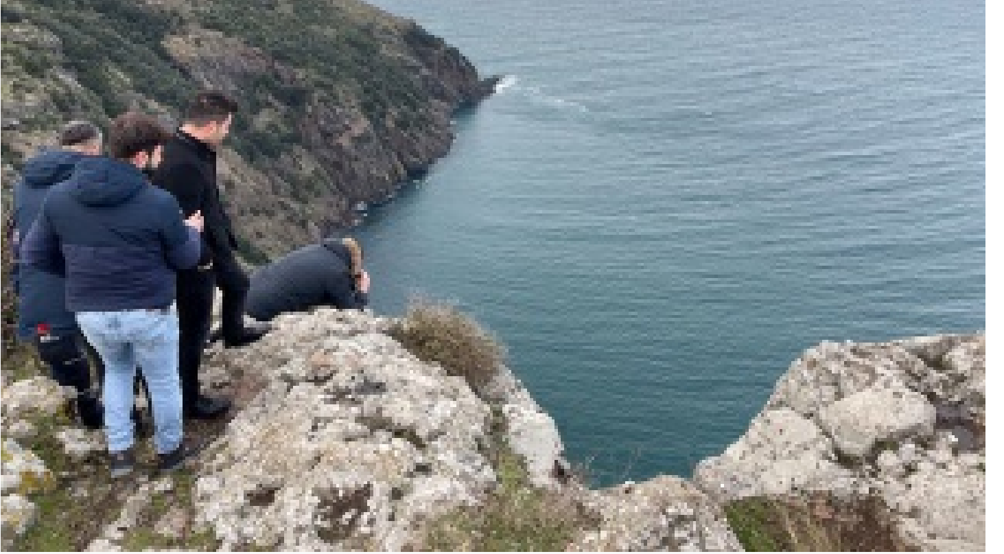
Sinop'ta uçurumda kadın cesedi bulundu