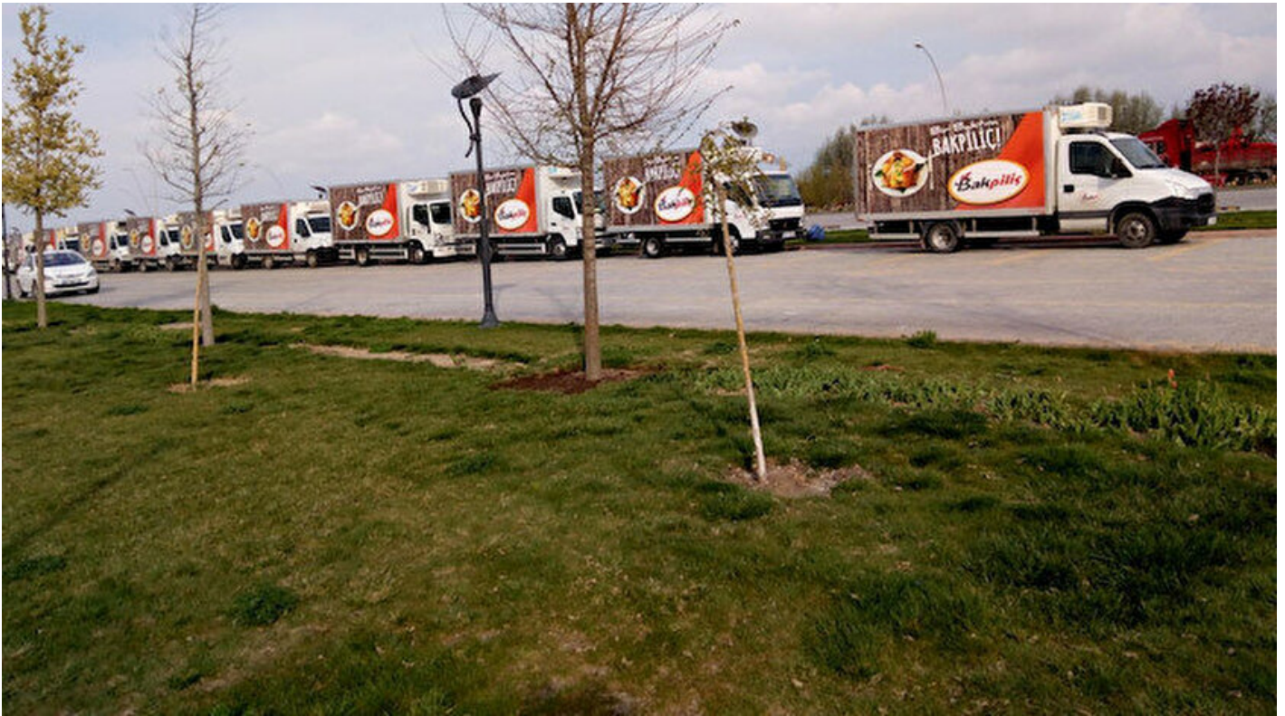
Bakpiliç Entegre Tavukçuluk A.Ş.

Haber Merkezi · 10 Mayıs 2019, 10:55 · Son Güncelleme: 10 Mayıs 2019, 11:11 · DHA