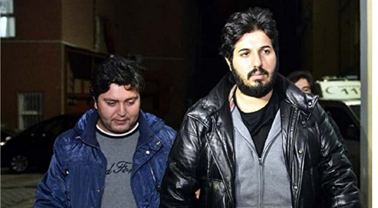
ABD'de tutuklu bulunan Reza Zarrab

Haber Merkezi · 28 Kasım 2017, 20:23 · Son Güncelleme: 28 Kasım 2017, 21:02 · Yeni Şafak