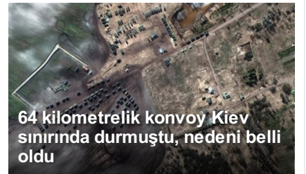
64 kilometrelik konvoy Kiev sınırında durmuştu, nedeni belli oldu