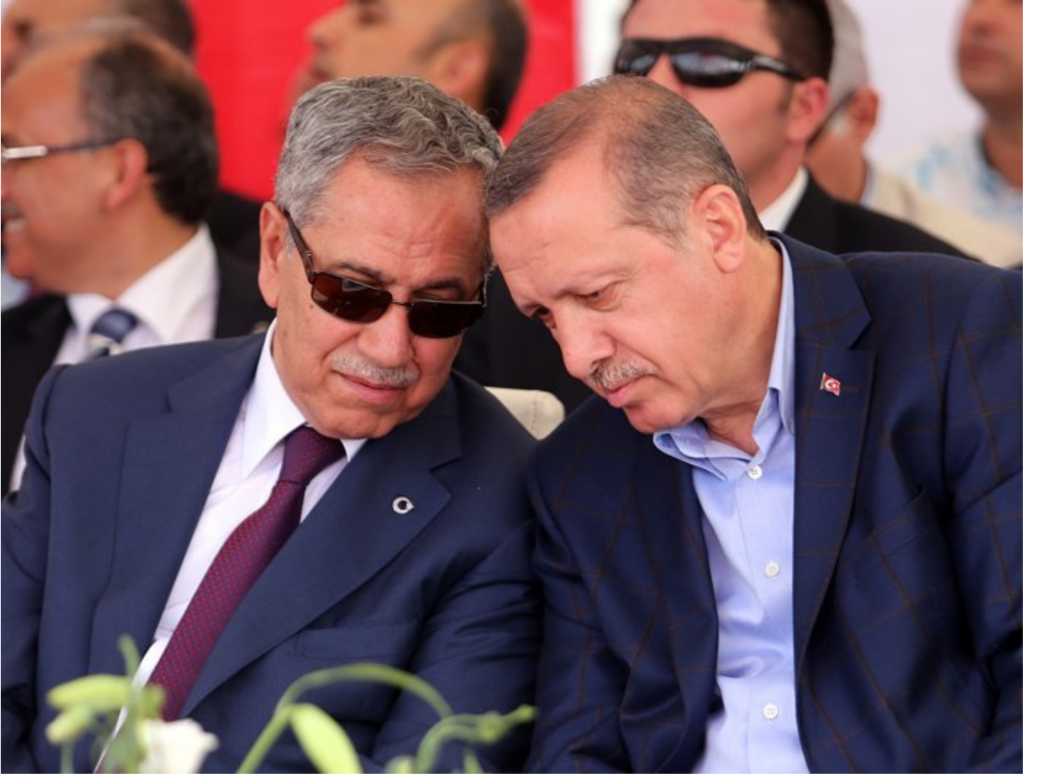
Cumhurbaşkanı Erdoğan ile Bülent Arınç, Refah Partisi yıllarından bu yana uzun yıllar birlikte siyaset yaptılar.

Fakat bir isim var ki neredeyse her dönemde Tayyip Erdoğan'ın yakın çevresinde oldu. Aralarındaki bazı fikir ayrılıkları kameralar önüne kadar yansısa da eski TBMM Başkanı ve Başbakan Yardımcısı Bülent Arınç her dönem siyasetin içinde aktif olarak rol aldı.