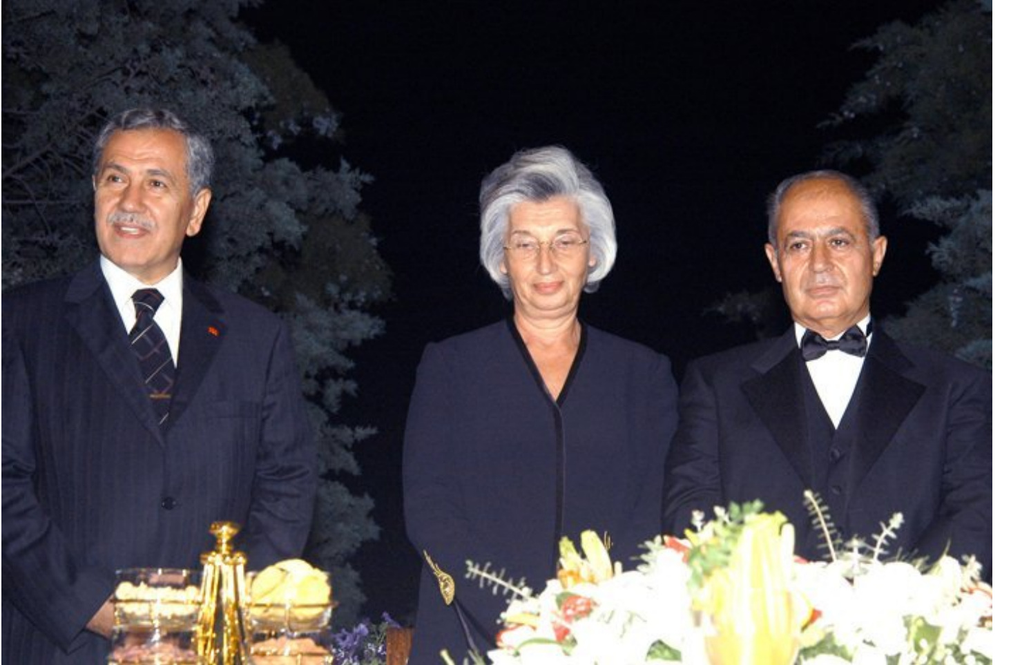
Bülent Arınç TBMM Başkanı sıfatı ile Cumhurbaşkanı Ahmet Necdet Sezer'in verdiği 30 Ağustos resepsiyonuna katılıyor. Arın. 2002-2007 yılları arasında TBMM Başkanlığı yapmıştı.