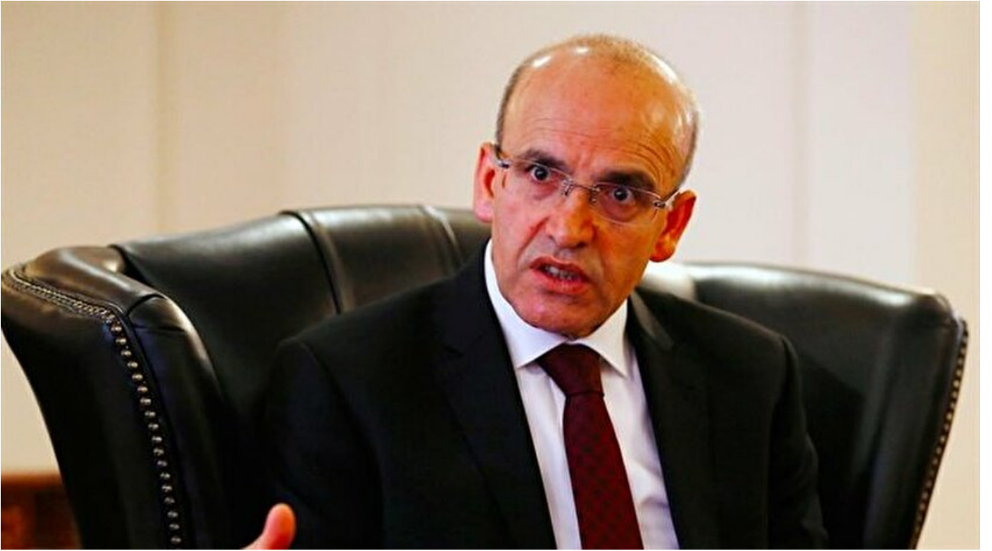
Ekonomiden sorumlu Başbakan Yardımcısı Mehmet Şimşek

Haber Merkezi · 07 Şubat 2018, 09:47 · Son Güncelleme: 07 Şubat 2018, 09:57 · AA