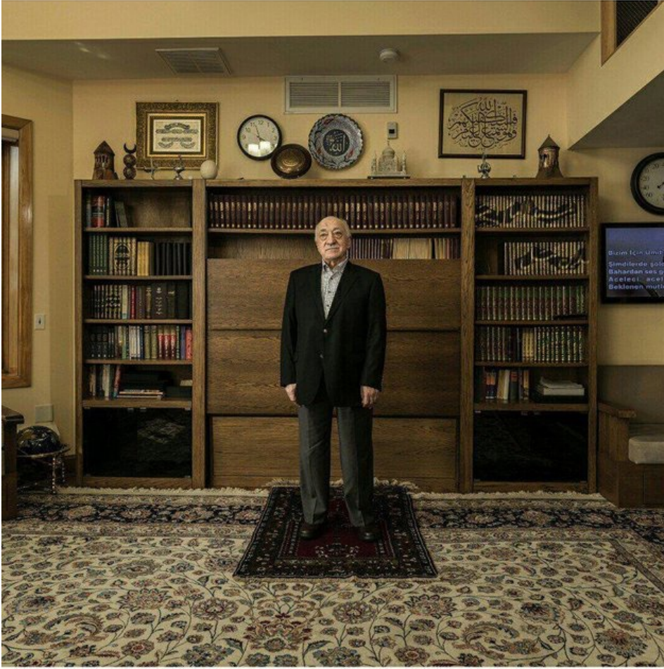
Fethullah Gulen in his compound in Saylorsburg, Pa. on Wednesday.