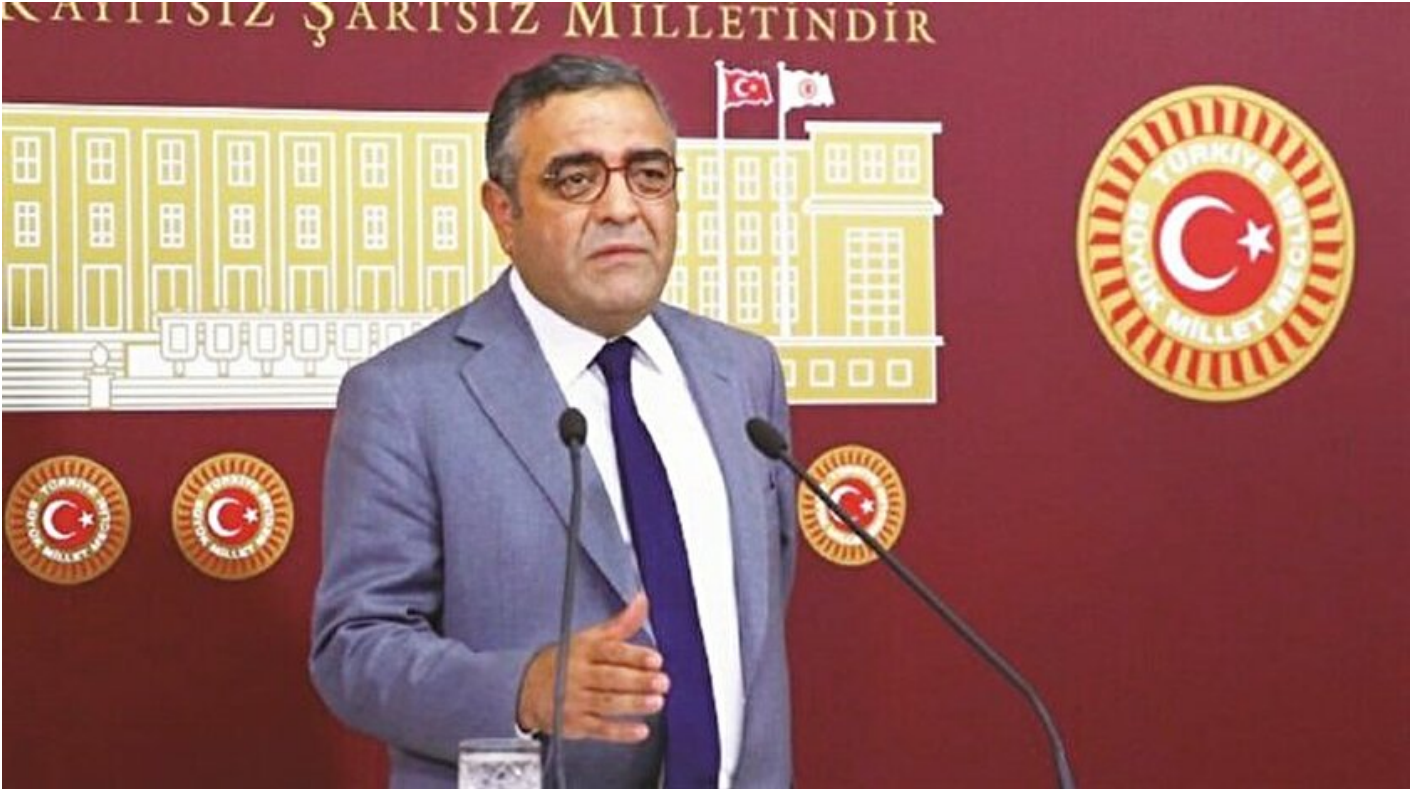
CHP İstanbul Milletvekili Sezgin Tanrikulu

Haber Merkezi · 01 Mart 2018, 04:00 · Yeni Şafak