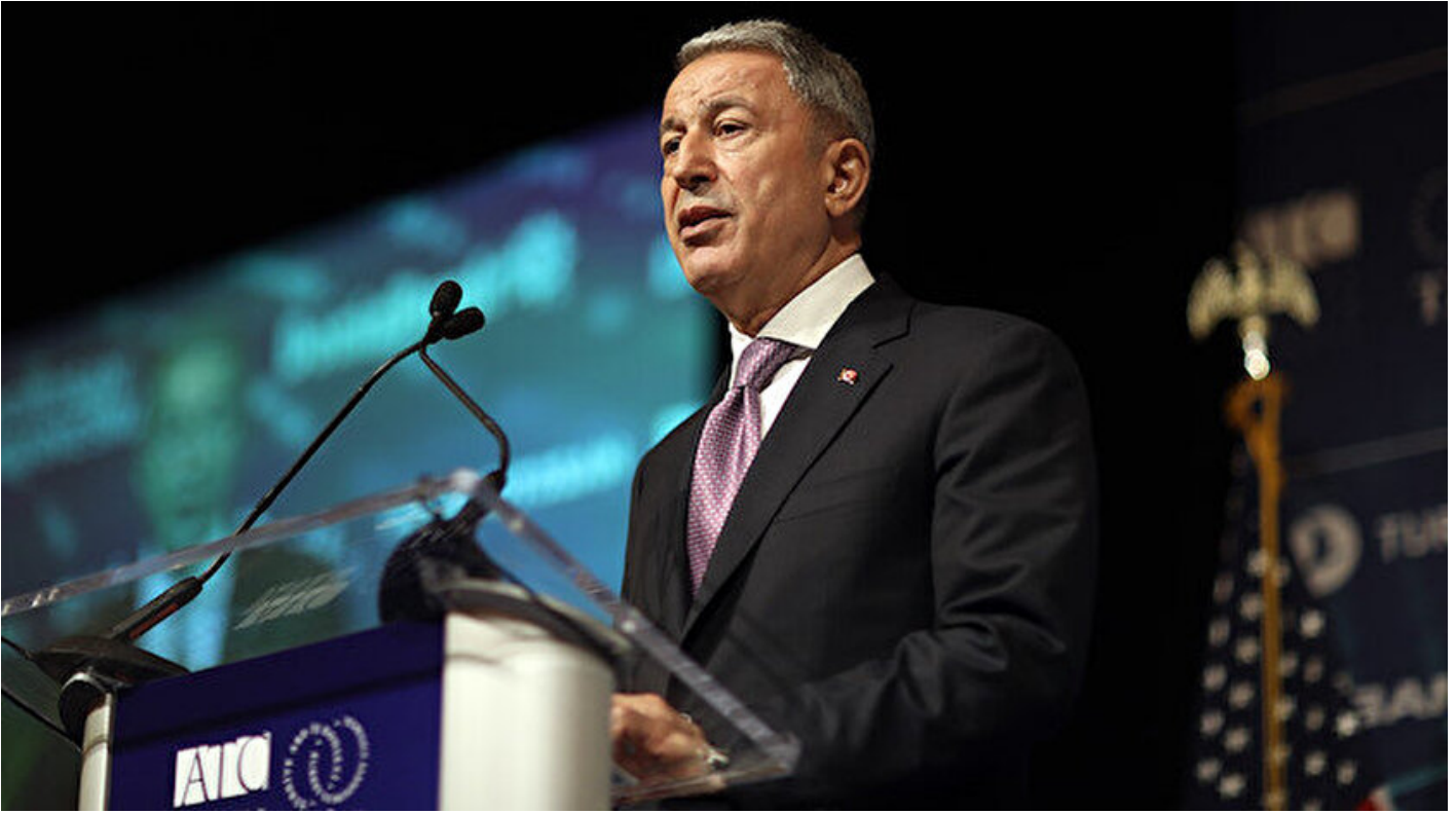
Milli Savunma Bakanı Hulusi Akar

Haber Merkezi · 15 Nisan 2019, 22:20 · Son Güncelleme: 15 Nisan 2019, 22:28 · AA