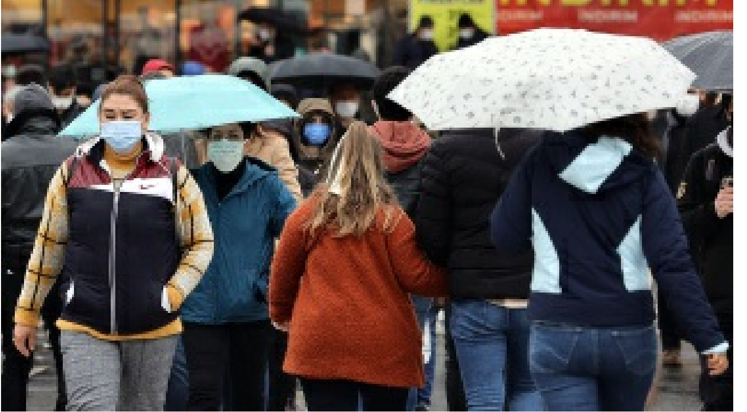
Mesafe yoksa açık alanda da maske