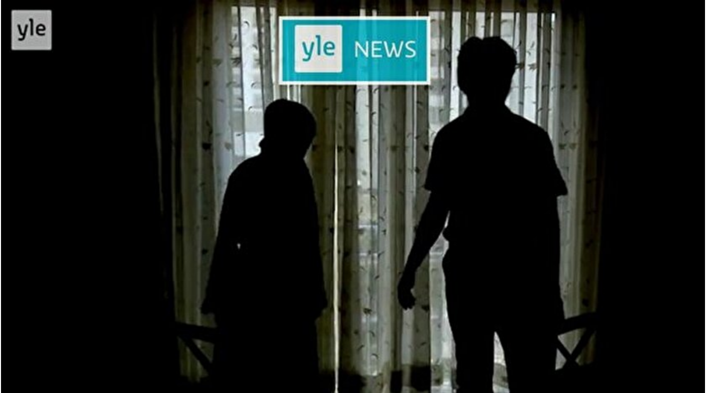
Finlandiya televizyonunda FETÖ propagandası

Mustafa Sait Özkan · 20 Şubat 2018, 04:00 · Son Güncelleme: 20 Şubat 2018, 10:52 · Yeni Şafak