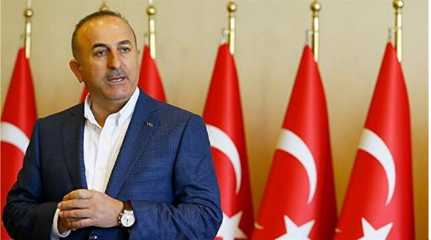
Dışişleri Bakanı Mevlüt Çavuşoğlu