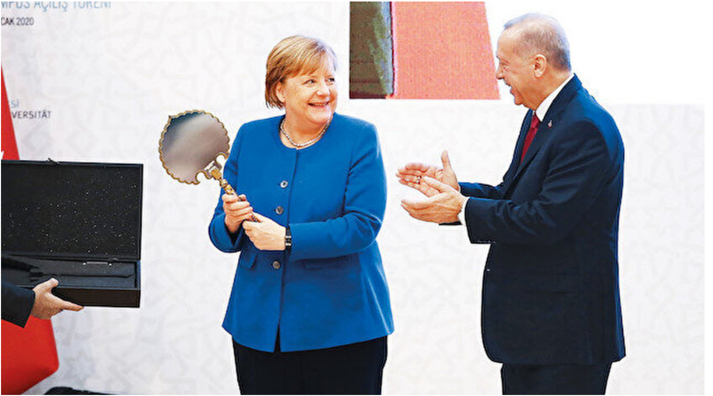
Recep Tayyip Erdoğan ve Angela Merkel