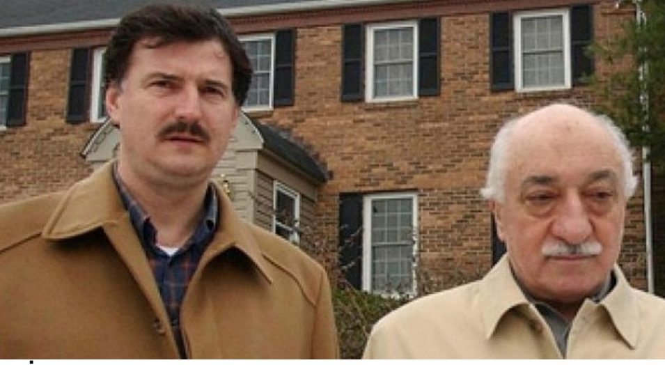
SAYLORSBURG'TA 6 AYRI