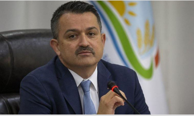
'Saray kabinesi tel tel dökülüyor!'