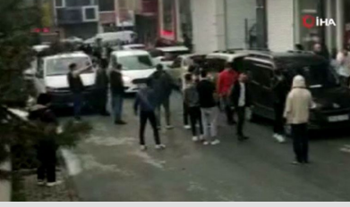
Uçan tekmeli kavga: Kaldırım taşları havada uçtu