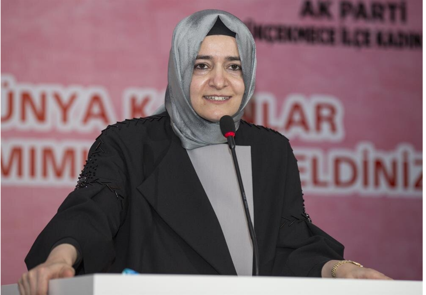
Fatma Betül Sayan Kaya

Bir toplumda eğer adalet duygusu tam olarak tesis edilmezse, kadın hak ve özgürlüklerinin de tesis edilmesinin mümkün olmadığını vurgulayan Kaya, AK Partinin temel ilkelerinden birinin de bu adaleti güçlü bir şekilde tesis etmek olduğunu, o nedenle kadını ötekileştiren ve yok sayan bir anlayışı reddettiklerini aktardı.