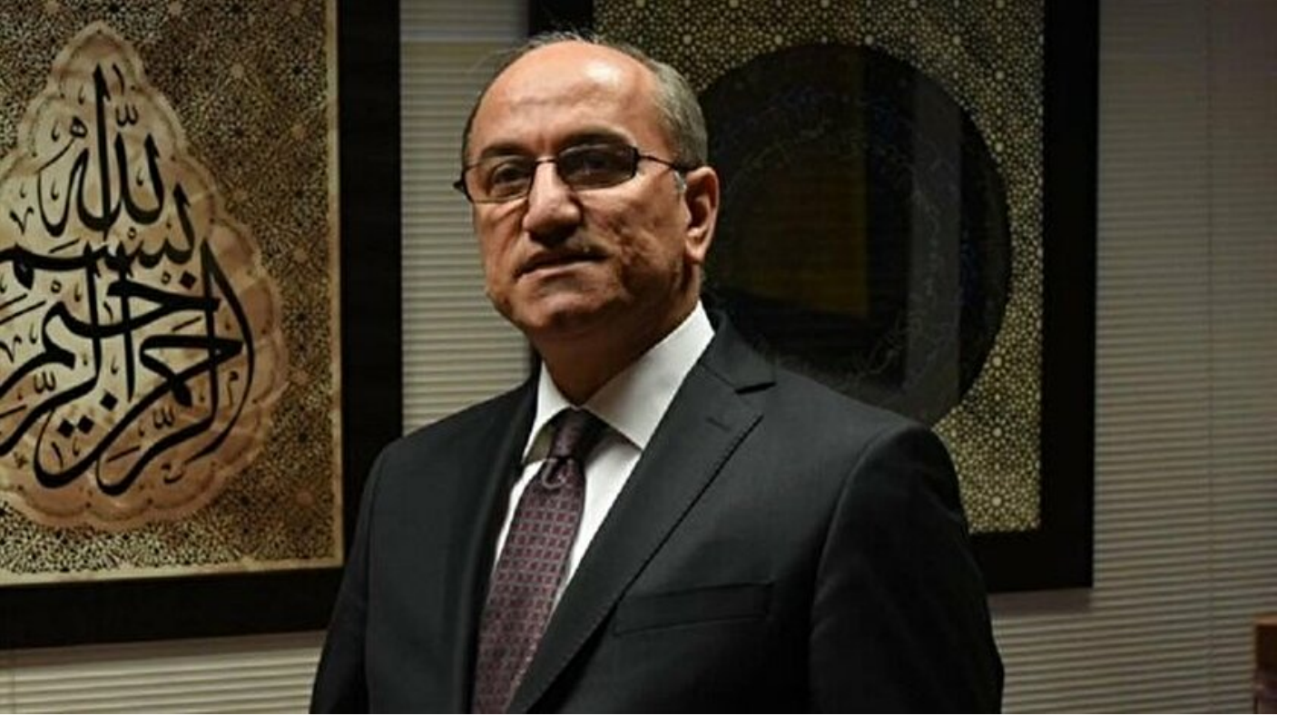
Türkiye'nin Londra Büyükelçisi Abdurrahman Bilgiç

Haber Merkezi · 12 Temmuz 2017, 11:35 · Son Güncelleme: 12 Temmuz 2017, 11:40 · AA